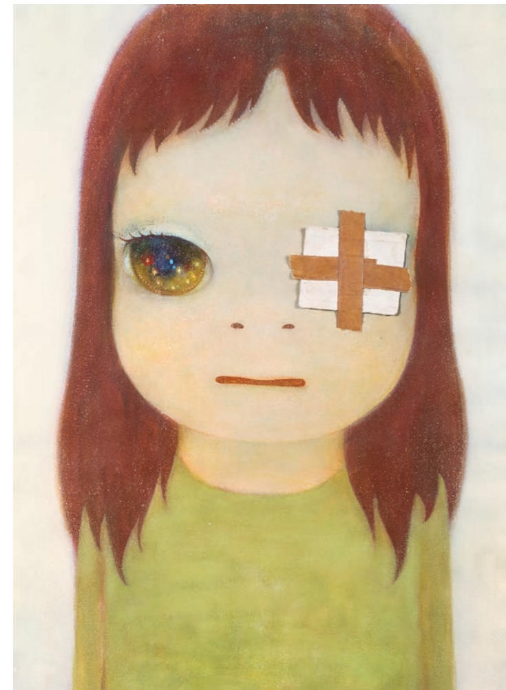
Untitled , 2007. Acrylic and collage on paper, 72,3 × 51,6 cm. Collection of the artist © Yoshitomo Nara. Courtesy Yoshitomo Nara Foundation

Même si ses portraits puissants rappellent les « mangas », bandes dessinées japonaises cultes, les personnages, animaux et créatures hybrides de Nara sont avant tout le reflet de ses propres souvenirs et