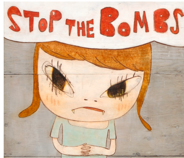
Stop the Bombs (Detail) , 2019. Acrylic on wood, framed, 149,5 × 117,5 × 7,7 cm. JUMEX Collection, Mexico © Yoshitomo Nara. Courtesy Yoshitomo Nara Foundation

« LÀ, EN CE MOMENT MÊME, UNE BOMBE EXPLOSE QUELQUE PART DANS LE MONDE. MAIS IL DOIT CERTAINEMENT Y AVOIR AUSSI UNE NOUVELLE VIE QUI VIENT AU MONDE À CE MOMENT PRÉCIS. < STOP THE BOMBS ! > JE LE RESENS DU PLUS PROFOND DE MON CŒUR ».