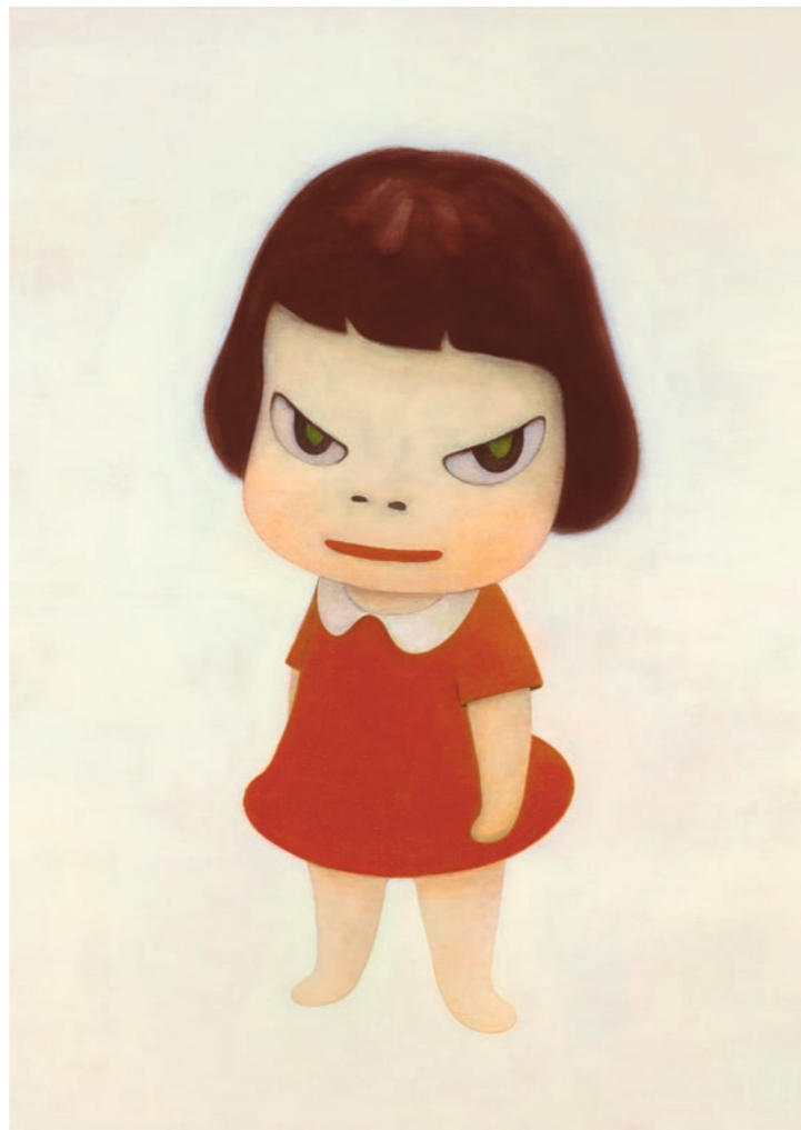
Missing in Action , 1999. Acrylic on canvas, 180 × 145 cm. Courtesy of Sally and Ralph Tawil © Yoshitomo Nara. Courtesy Yoshitomo Nara Foundation

mondes émotionnels. Ainsi, dans ces représentations, l'artiste traite également de ses propres expériences d'enfance, souvent marquées par la solitude et l'isolement en raison de ses parents qui travaillaient. Mais son amour de la musique et de la littérature, sa connaissance de l'histoire de l'art japonais et européen ainsi que sa confrontation avec d'autres cultures lui servent également de sources d'inspiration très diverses. Dans ses œuvres, Nara oppose à l'esthétique « kawaii » typique du Japon, qui mise sur des motifs fortement minimisés, des protagonistes rebelles et insoumis. Elles sont emblématiques de l'attitude pacifiste, socialement critique et ouverte sur le monde de l'artiste, qui est également marquée par son étude intensive du rôle historique du Japon pendant la Seconde Guerre mondiale.