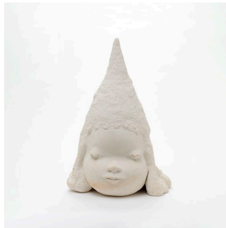
Little Thinker in Silence , 2016. Ceramic, 74 × 55 × 48 cm. Private collection © Yoshitomo Nara. Courtesy Yoshitomo Nara Foundation

Japanese artist Yoshitomo Nara (b. 1959) is one of the most celebrated representatives of his generation. He received international recognition for his Angry Girls : stylized depictions of large-headed children with captivating eyes who appear threatening, defiant, angry, or melancholy and insecure—and are now considered veritable icons of contemporary painting. While the aesthetics of Nara's characters are reminiscent of the Japanese cult comics known as mangas, his figures, animals, and hybrid creatures are first and foremost a reflection of his own memories and feelings. In these works, the artist explores his own experiences of childhood, much of which was marked by loneliness and isolation due to the fact that he had working parents. In spite of this, his love of music and literature, his knowledge of Japanese and European art history, and his encounters with other cultures provided him with varied sources of inspiration. In his work, Nara counters kawaii aesthetics—the typically Japanese style of exaggerated cuteness—with rebellious and recalcitrant protagonists. These figures symbolize the artist's pacifist, socially critical, and cosmopolitan attitude that is influenced by his in-depth examination of Japan's historical role during World War II.