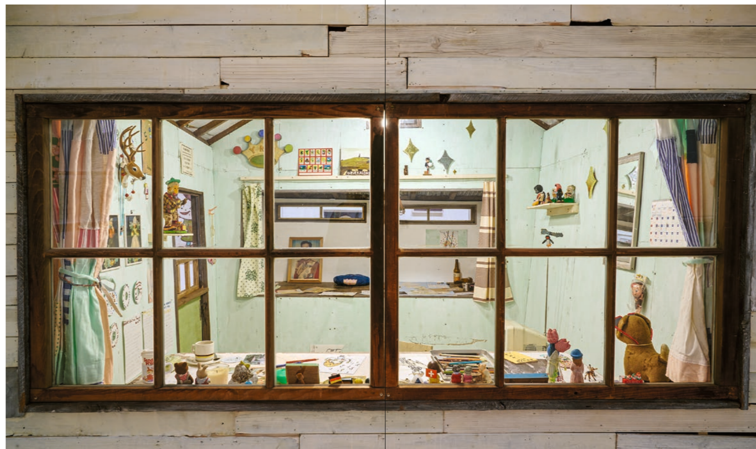
My Drawing Room 2008, Bedroom Included, 2008. Installation (Mixed Media) 301,5 × 375 × 380 cm. Collection of the artist © Yoshitomo Nara. Courtesy Yoshitomo Nara Foundation.

In the exhibition Yoshitomo Nara , the artist's first major retrospective in Germany, the Museum Frieder Burda presents paintings, drawings, sculptures, and installations from the past four decades. In a sense, this allows this extraordinary Japanese artist to return to the country that significantly formed his biography. Nara was born in a suburb of Hirosaki in the isolated north of Japan in 1959. After studying painting at the University of the Arts in Aichi, he moved to the renowned Kunstakademie in Düsseldorf in the late 1980s. For twelve years he remained in Germany, and it was here that he developed his unique visual language. In 2000 Nara returned to Japan, where he is still active as an artist.