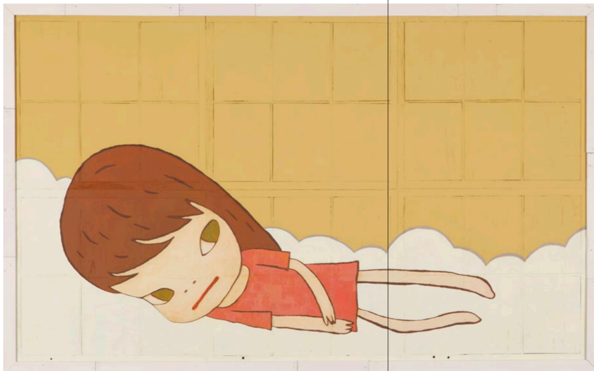
One Foot in the Groove , 2012. Acrylic on wood, framed, 187,5 × 310 × 8,5 cm. YAGED Foundation Collection, Taiwan © Yoshitomo Nara. Courtesy Yoshitomo Nara Foundation

L'exposition a été réalisée en étroite collaboration avec Yoshitomo Nara lui-même et est le fruit d'une coopération avec le Guggenheim Museum Bilbao et la Hayward Gallery de Londres. Parmi les nombreux prêteurs internationaux figurent notamment la Jumex Collection de Mexico City, le Leeum Museum of Art de Séoul, le National Museum of Art d'Osaka et le National Museum of Modern Art de Tokyo. Parmi les œuvres phares de l'exposition figurent également de nombreux chefs-d'œuvre issus de collections privées internationales, qui sont d'ordinaire inaccessibles au public.